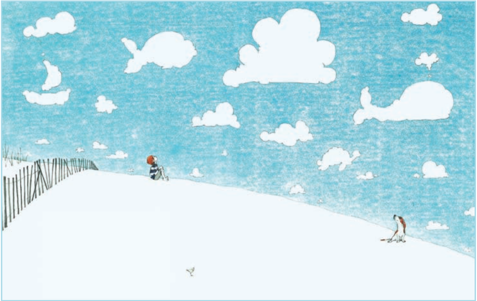
Illustration von Erin E. Stead aus „Wenn du einen Wal sehen willst“ von Julie Fogliano, © FISCHER Sauerländer, 2014