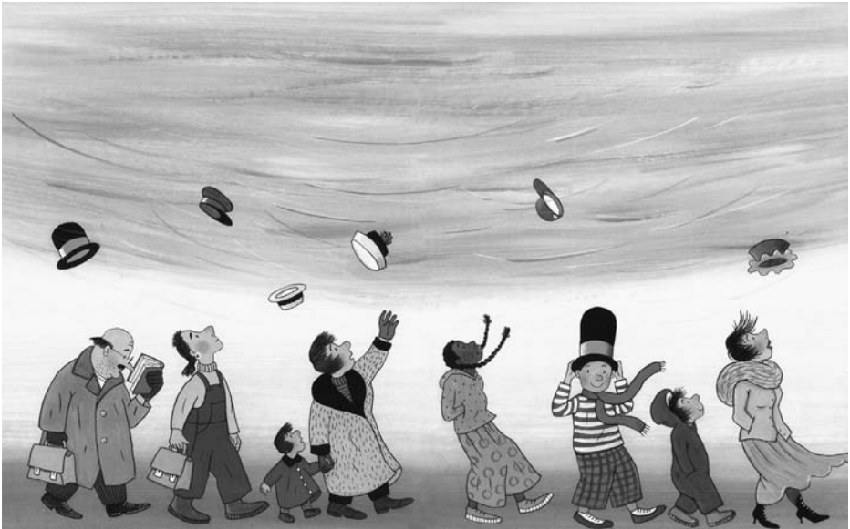
Illustration von Rotraud Susanne Berner aus „Der fliegende Hut“, Aladin Verlag Hamburg 2017, Seite 4