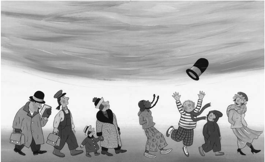
Illustration aus: „Der fliegende Hut“ von Rotraud Susanne Berner, Aladin Verlag, Hamburg 2017, Seite 4