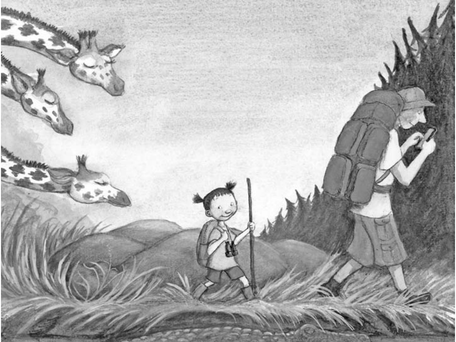
Illustration aus: „Vorsicht Krokodil“ von Eva Eriksson, Lisa Moroni, Moritz Verlag, 2014, Seite 4