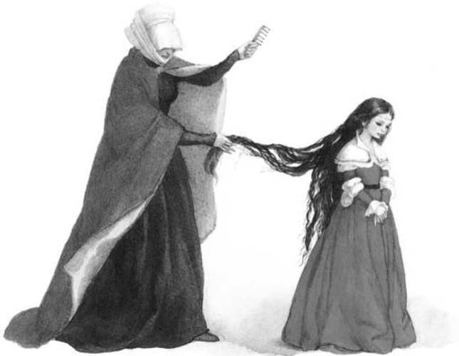
Illustration von Anastassija Archipowa aus „Die schönsten Märchen der Brüder Grimm“, Esslinger Verlag 2010, Seite 19

Gutzschhahn, Uwe-Michael (Hrsg.) / Wilharm, Sabine (Illustration)