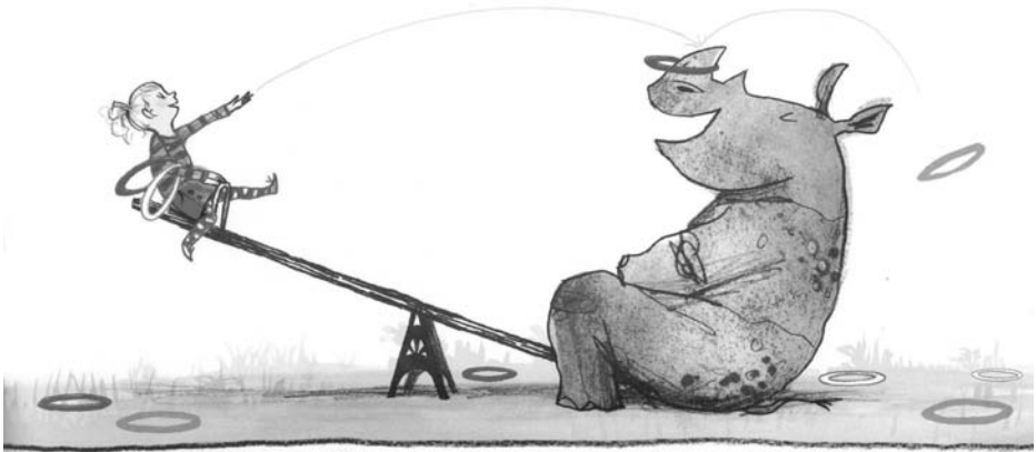
Wenn ein lila Nashorn kommt. Text: Anna Kemp. Illustrationen: Sara Ogilvie. © 2012 Gerstenberg Verlag, Hildesheim, Seite 4