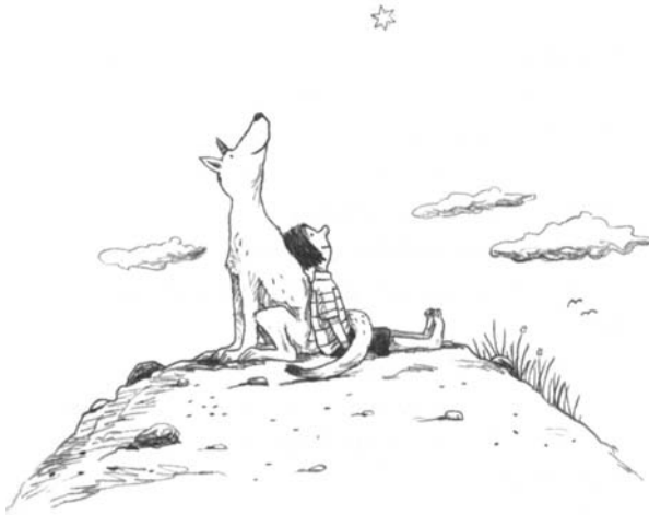
Illustration von Philip Waechter aus: Asa Lind, Alles von Zackarina und dem Sandwolf ©2008 Gulliver in der Verlagsgruppe Beltz · Weinheim Basel, Seite 10

Collodi, Carlo, / Ingpen, Robert (Illustration)