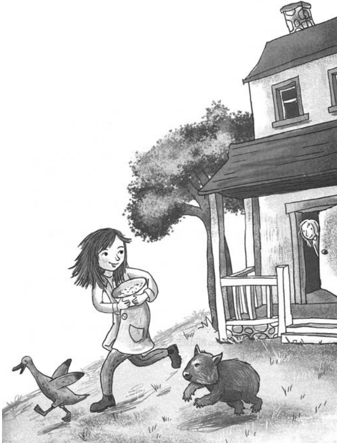
Illustration von Barbara Korthues aus Wombat Warriors von Samantha Wheeler; Rowohlt Verlag, Seite 13

Freund, Wieland / Jung, Hanna (Illustration)