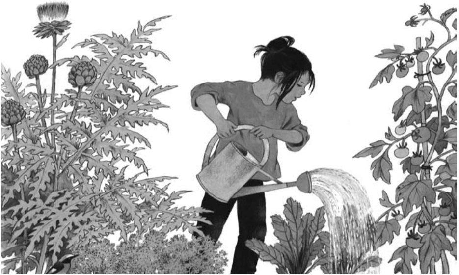
Illustration von Gerda Muller aus „Was wächst denn da?“, Moritz Verlag, Seite 9