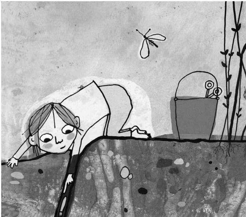
Illustration von Antje Damm aus „Was wird aus uns?“, Moritz Verlag, Frankfurt a.M. 2018, Seite 14

Wuppertal 2011 – Peter Hammer Verlag – 405 S. – für junge Erwachsene – 26.00 €