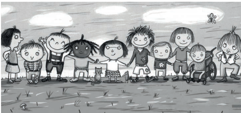
Illustration von Daniela Kulot aus „Zusammen!“ vom Gerstenberg Verlag, Seite 6

Wuppertal 2019 – Peter Hammer – 160 Seiten – ab 8 Jahren – 14.00 €