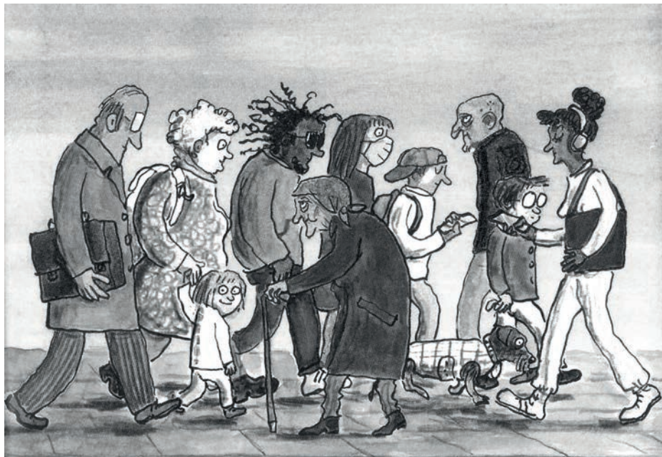
Illustration von © Anke Kuhl aus „AnyBody“ von Katharina von der Gathen aus dem Klett Kinderbuch Verlag 2021, Seite 11