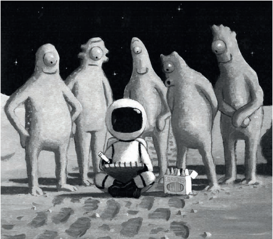
Illustration von John Hare aus „Ausflug zum Mond“, Moritz Verlag, Seite 5