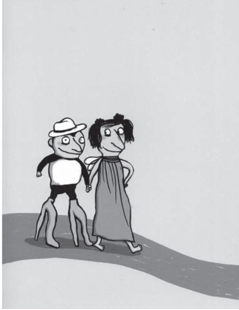
Illustration von Nadia Budde aus „Und außerdem sind Borsten schön“, vom PeterHammer Verlag, Seite 4